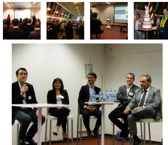
13/10/2016 – IT Tour à Nantes organisé par Le Monde Informatique en présence d'une centaine de personnes et du robot Peepor .

Étape par étape : comment bien effacer et conserver vos données informatiques stockées sur votre ordinateur professionnel si vous changez de travail à la rentrée (et pourquoi c'est très important)